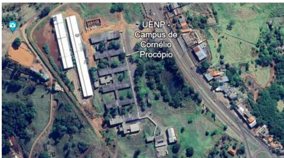
Figura 04 - Localização da área de adequação da Reitoria

- Campus de Cornélio Procópio: Localizado na PR 160, Km 0 (saída para Leópolis), CEP 86300-000.