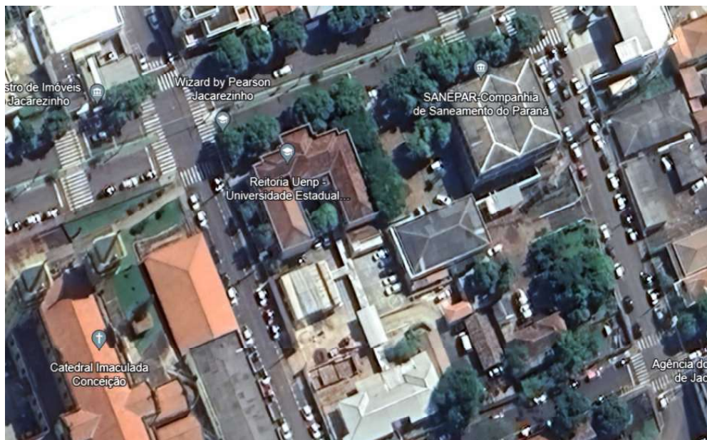
Figura 03 - Localização da área de adequação da Reitoria